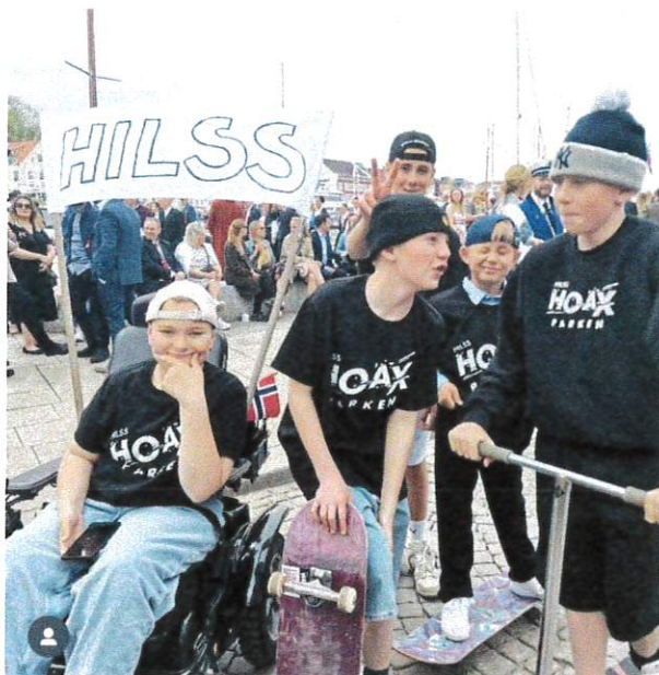
HILSS - gjengen i folketoget 17.mai 22