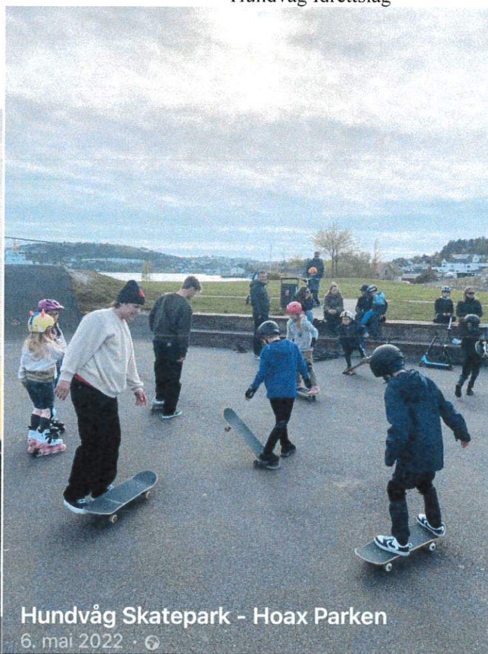
Skatekurs i HOAX-parken

Styremøter i HILSS har vært 31.1, 9.3, 20.4,13.6, 24.8,19.10,14.12