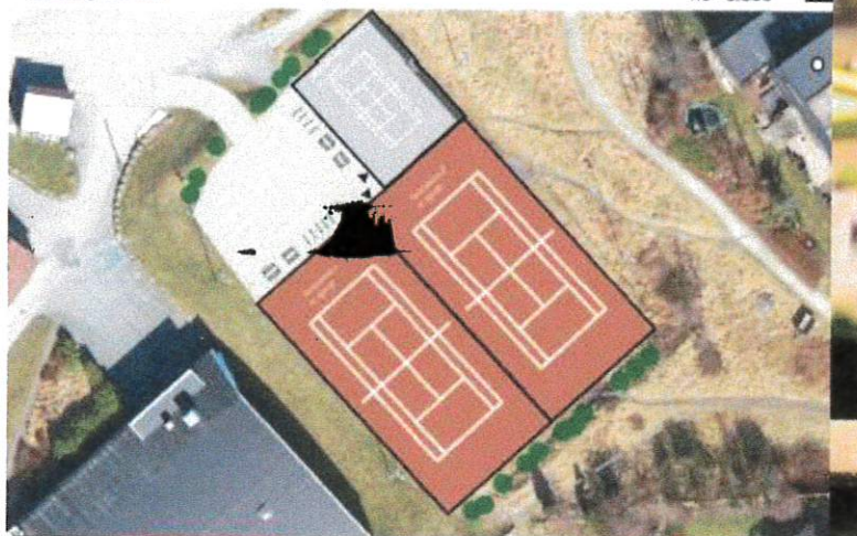
A3 - 1:250